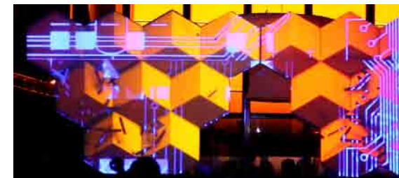
EdgeNight : performance de mapping et sonorités électro au programme !

Rencontres créatives ouvertes à tous autour d'ateliers et de non-confé- rences à la Plage Digitale. Les publics et futurs partenaires du projet Seeg- muller pourront se croiser et échanger autour des passions et valeurs qui les réunissent mais aussi partager l'esprit d'initiative qui les anime et les projets communs à mettre en place.